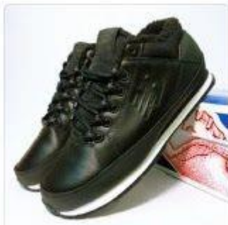
Зимние Кроссовки NB ... 2 990 Р 3 990 Р