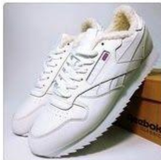
Зимние Кроссовки Ree... 2 990 Р 3 690 Р