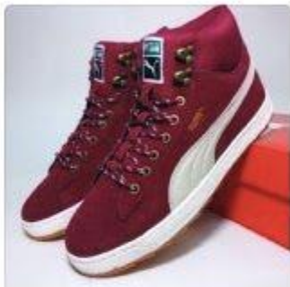
Зимние Кроссовки Sue... 2 990 Р 3 990 Р